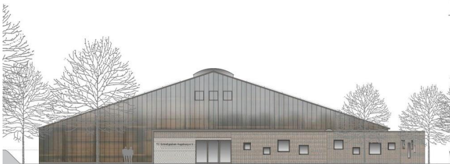
Fassadenstudie - Ansicht Nord-Ost (vom Parkplatz)