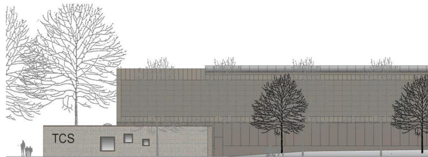
Fassadenstudie - Ansicht Nord-West (von Stadionstraße)